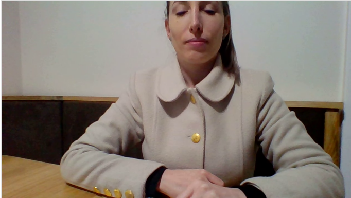
video.webm 5:07 vídeo PADLET DRIVE

Quem não tiver acesso ao vídeo, pode apenas ler e observar as imagens; Quem tiver acesso, vamos brincar de mímica?