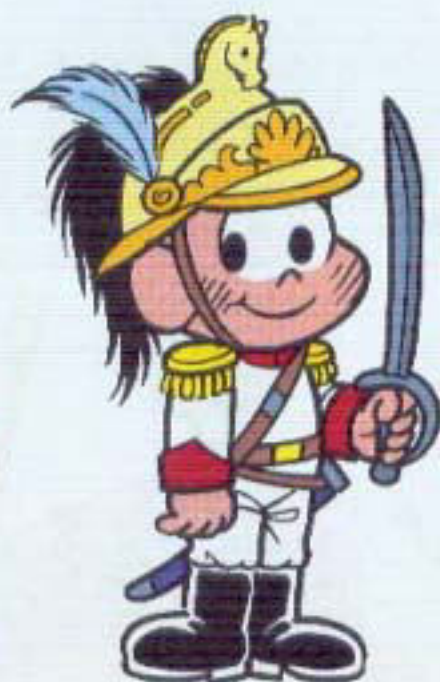
DRAGÃO DA INDEPENDÊNCIA (SOLDADO DE CAVALARIA)