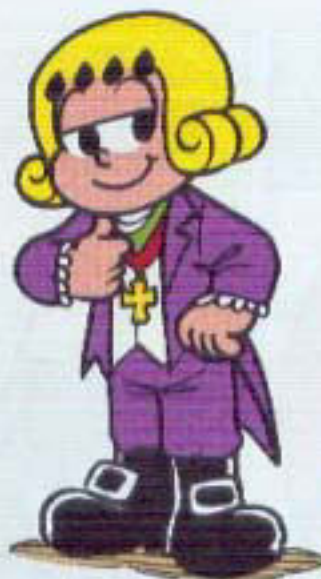
JOSÉ BONIFÁCIO (PATRIARCA DA INDEPENDÊNCIA)