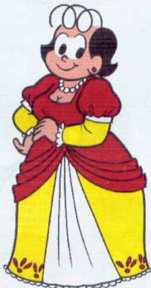
CARLOTA JOAQUINA (MÃE DE DOM PEDRO I)