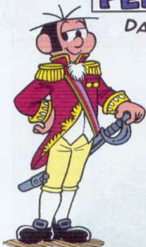
DOM JOÃO (PAI DE DOM PEDRO I)