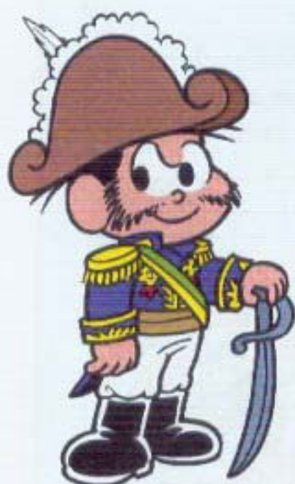
DOM PEDRO I (IMPERADOR DO BRASIL)