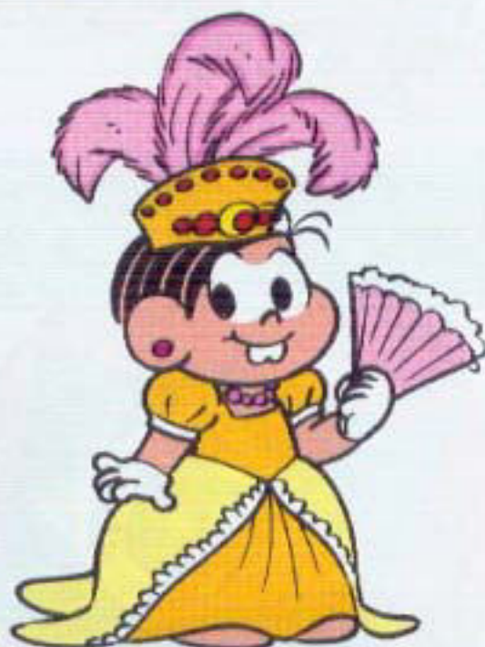
IMPERATRIZ LEOPOLDINA (MULHER DE DOM PEDRO I)