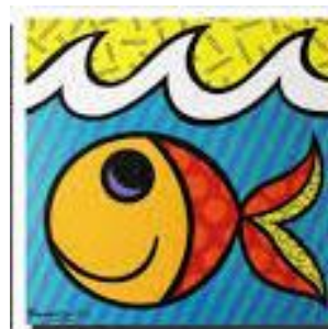
Figura é tudo aquilo que se destaca e fica mais a frente em alguma composição ou obra. Seria a parte principal. Fundo é tudo aquilo que fica mais atrás, na parte secundária. Ao mesmo tempo, representa o entorno da figura. Ambos se complementam, se harmonizam e compõem juntos uma obra.

Para hoje, vamos retomar os conceitos de figura e de fundo.