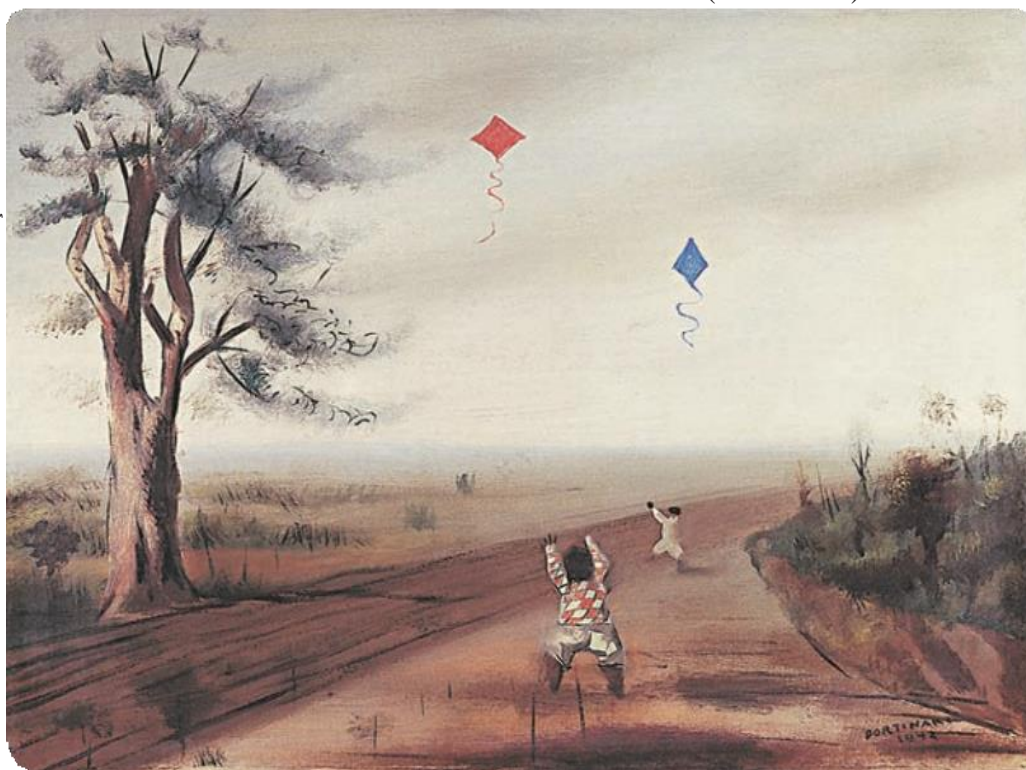
NOME: BRODOWSKI , ÓLEO SOBRE TELA DE CANDIDO PORTINARI, 1942.

© João Cândido Portinari/Projeto Portinari - coleção Particular Cópia autorizada