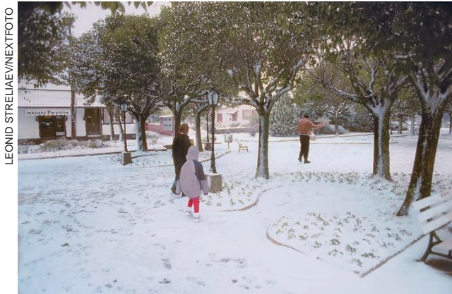
NEVE NA CIDADE DE GRAMADO, RIO GRANDE DO SUL, EM 1998.