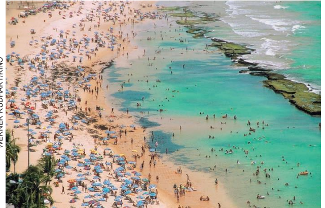
PRAIA DE BOA VIAGEM, RECIFE, EM 2004.