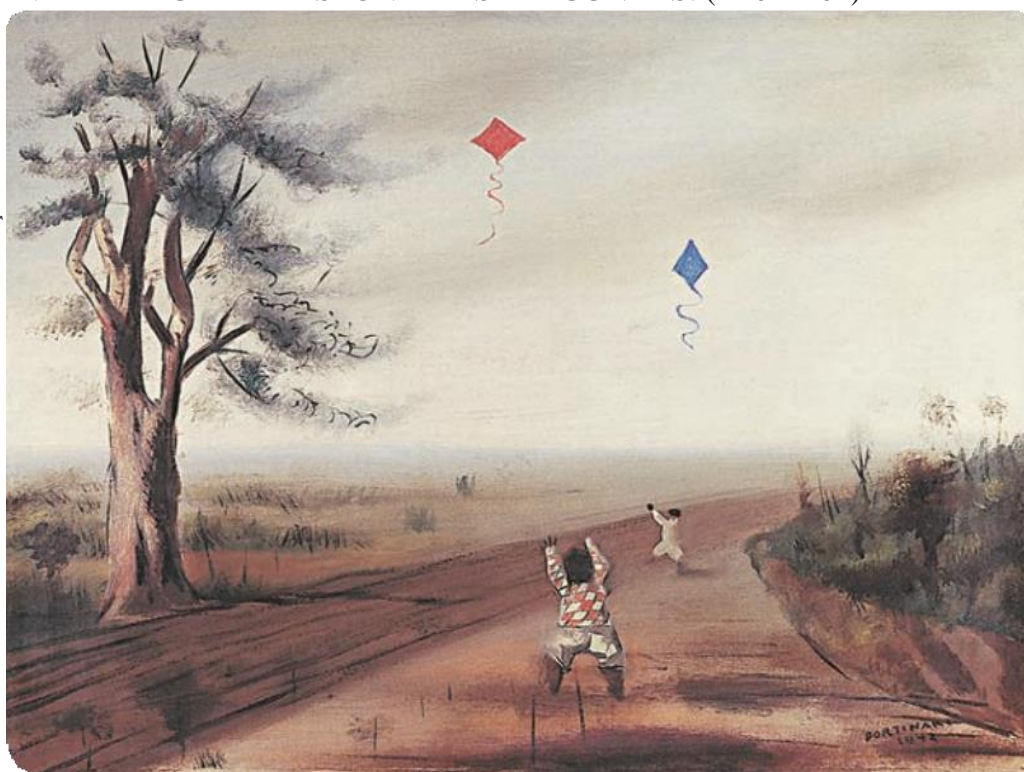
NOME: BRODOWSKI , ÓLEO SOBRE TELA DE CANDIDO PORTINARI, 1942.

© João Cândido Portinari/Projeto Portinari - coleção Particular Cópia autorizada