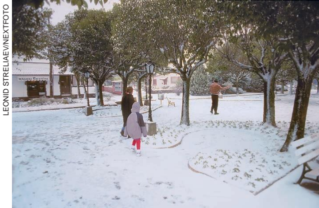
NEVE NA CIDADE DE GRAMADO, RIO GRANDE DO SUL, EM 1998.