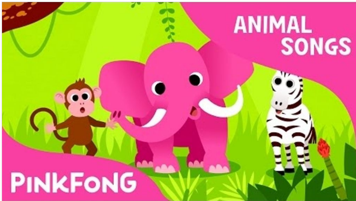
Animals, Animals | Animal Songs | PINKFONG Songs for Children por Pinkfong! Kids' Songs & Stories YOUTUBE

Vamos cantar uma canção sobre os ANIMALS?