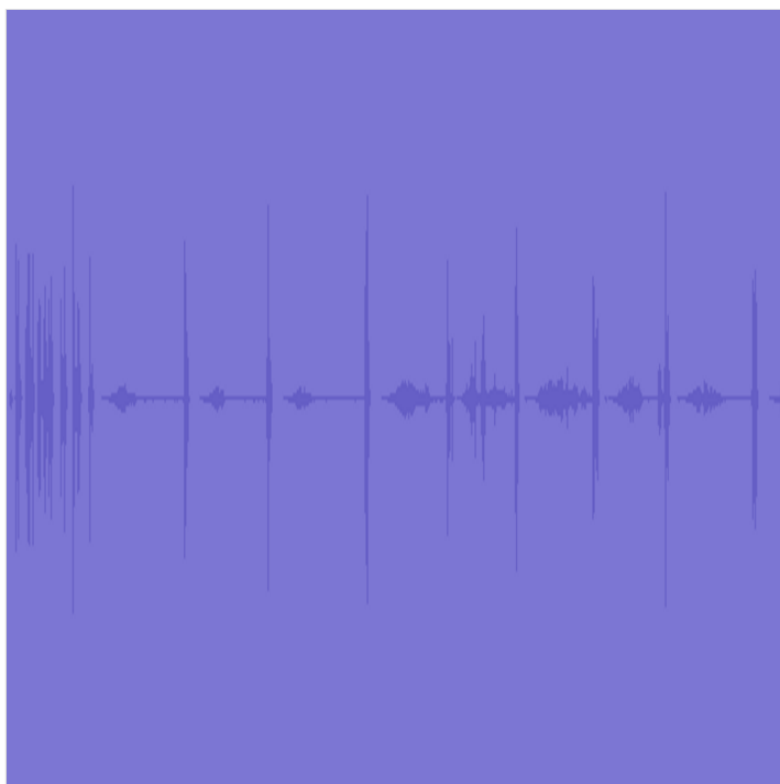
audio Áudio de 2:12 PADLET DRIVE