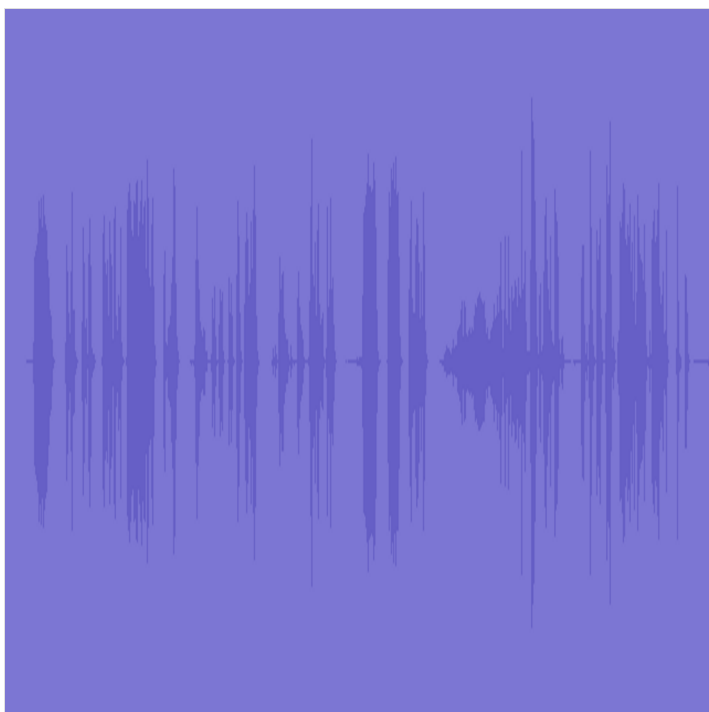
audio Áudio de 1:12 PADLET DRIVE

Ouçã o áudio ou, para quem tem aparelho de CD, pode ouvir a faixa 42.