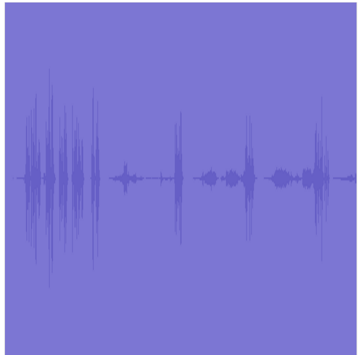
audio Áudio de 1:07 PADLET DRIVE