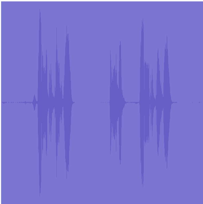
audio Áudio de 0:10 PADLET DRIVE