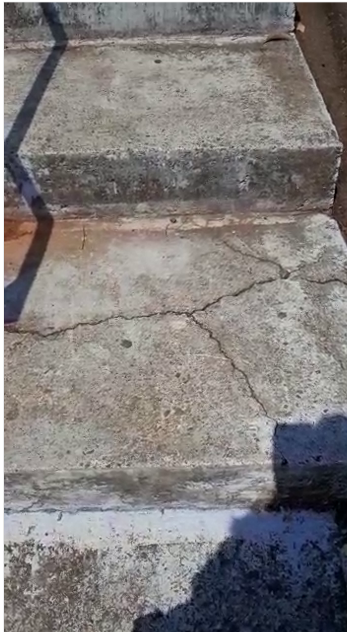
SUBINDO DEGRAUS 1-20

Exercício 7: Conte a quantidade e escreva o número em inglês.