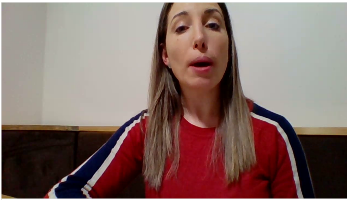
video PADLET DRIVE