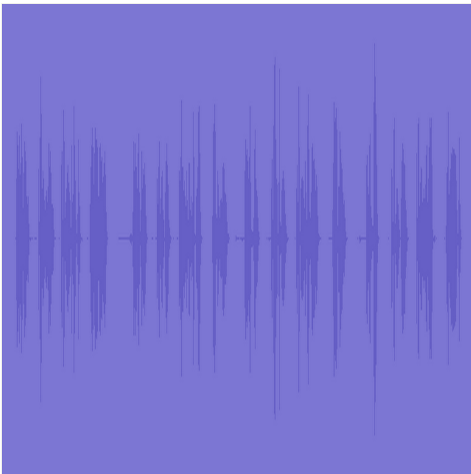
audio Áudio de 0:44 PADLET DRIVE

Exercício 6: Ouça o áudio e numere as imagens. Observe os horários e as frases.