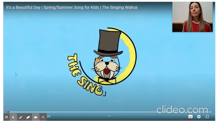
IT'S A BEAUTIFUL DAY SONG Vídeo de 3:01 PADLET DRIVE

Agora assista a uma canção que se chama "IT'S A BEAUTIFUL DAY":