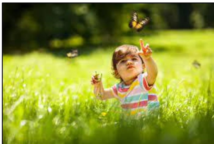
Exemplo de criança explorando e observando a natureza.