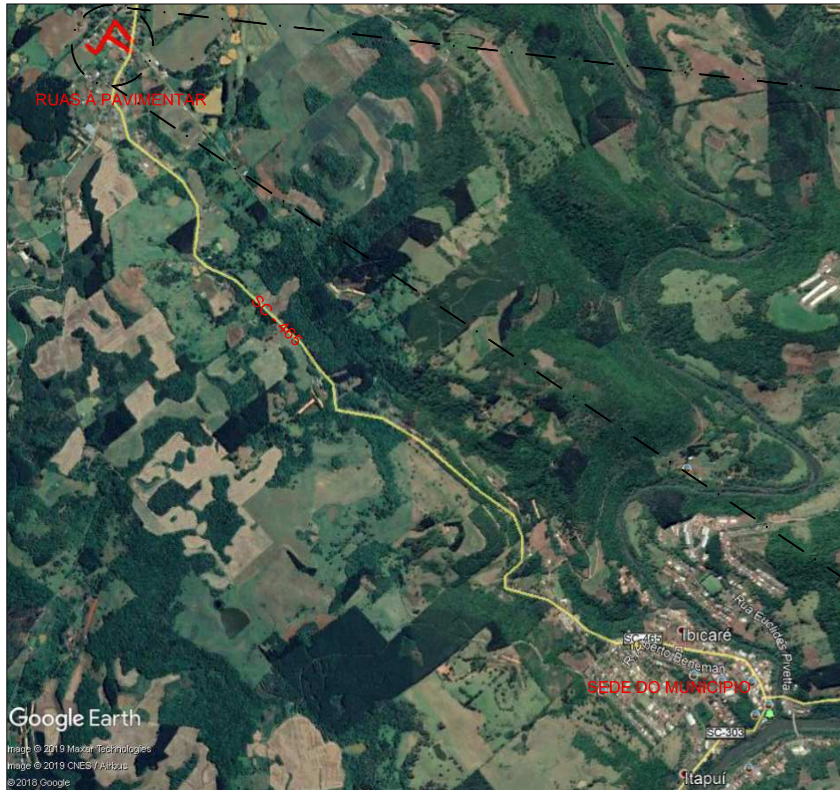
LOCALIZAÇÃO Escala: 1/20000